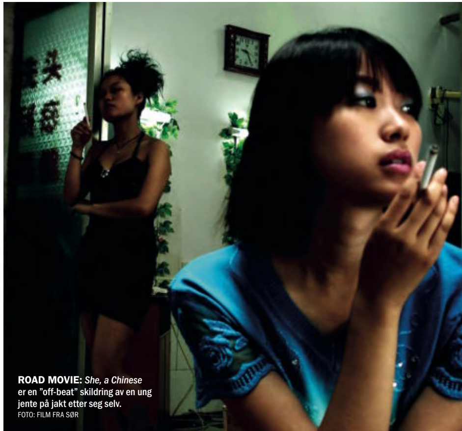
ROAD MOVIE: She, a Chinese er en "off-beat" skildring av en ung jente på jakt etter seg selv.

De kvinnelige regissørens brennende engasjement reflekteres i filmene de lager. Lasse Skagen