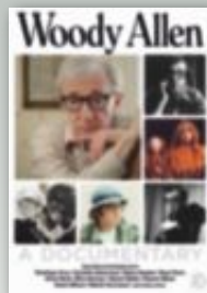
WOODY ALLEN: A DOCUMENTARY Regissør: Robert B. Weide Genre: Dokumentar Land: USA (2011) I Norge fra 8. juni