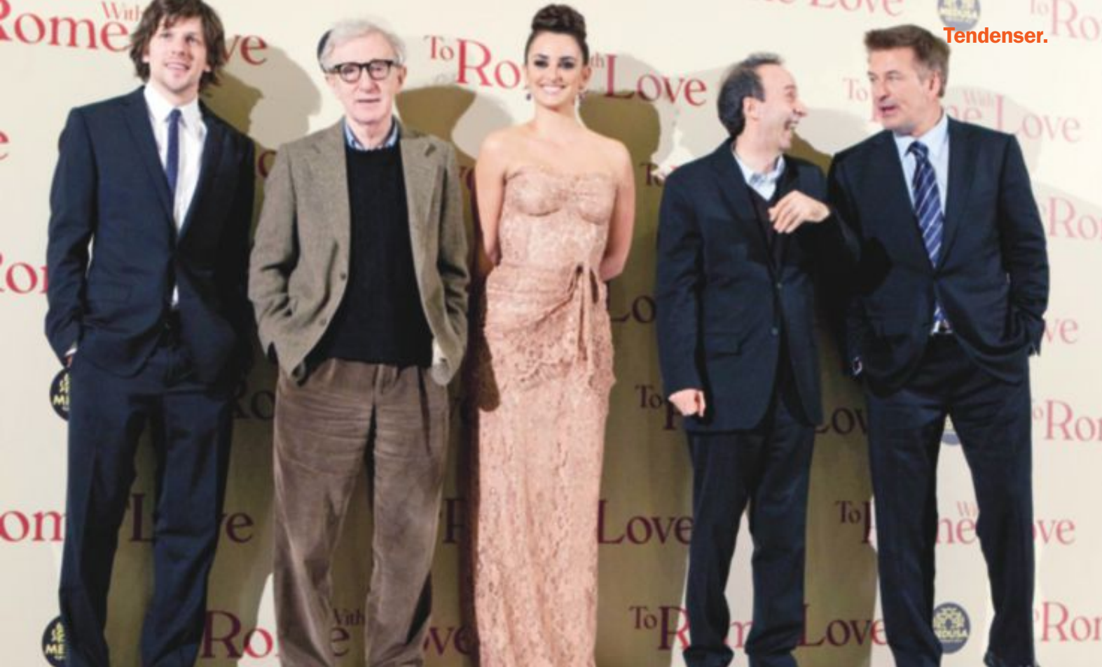
EUROPA: Woody Allen har tidligere laget filmer fra London, Barcelona, Paris og nå Roma. To Rome with Love kommer til Oslo fra 29. juni. Her er besetningen med fra venstre, Jesse Eisenberg, Woody Allen, Penelope Cruz, Roberto Benigni og Alec Baldwin.

les med de rollefigurene Allen selv spilte på 70-tallet, og filmen er håndverksmessig perfekt, samt passe søt og intelligent nok til at det er fristende å kalle den et mesterverk.