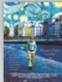
A MIDNIGHT IN PARIS Regissør: Woody Allen Genre: Komedie / Romantikk Lengde: 1 t. 34 min. Land: Spania, USA, England (2011)