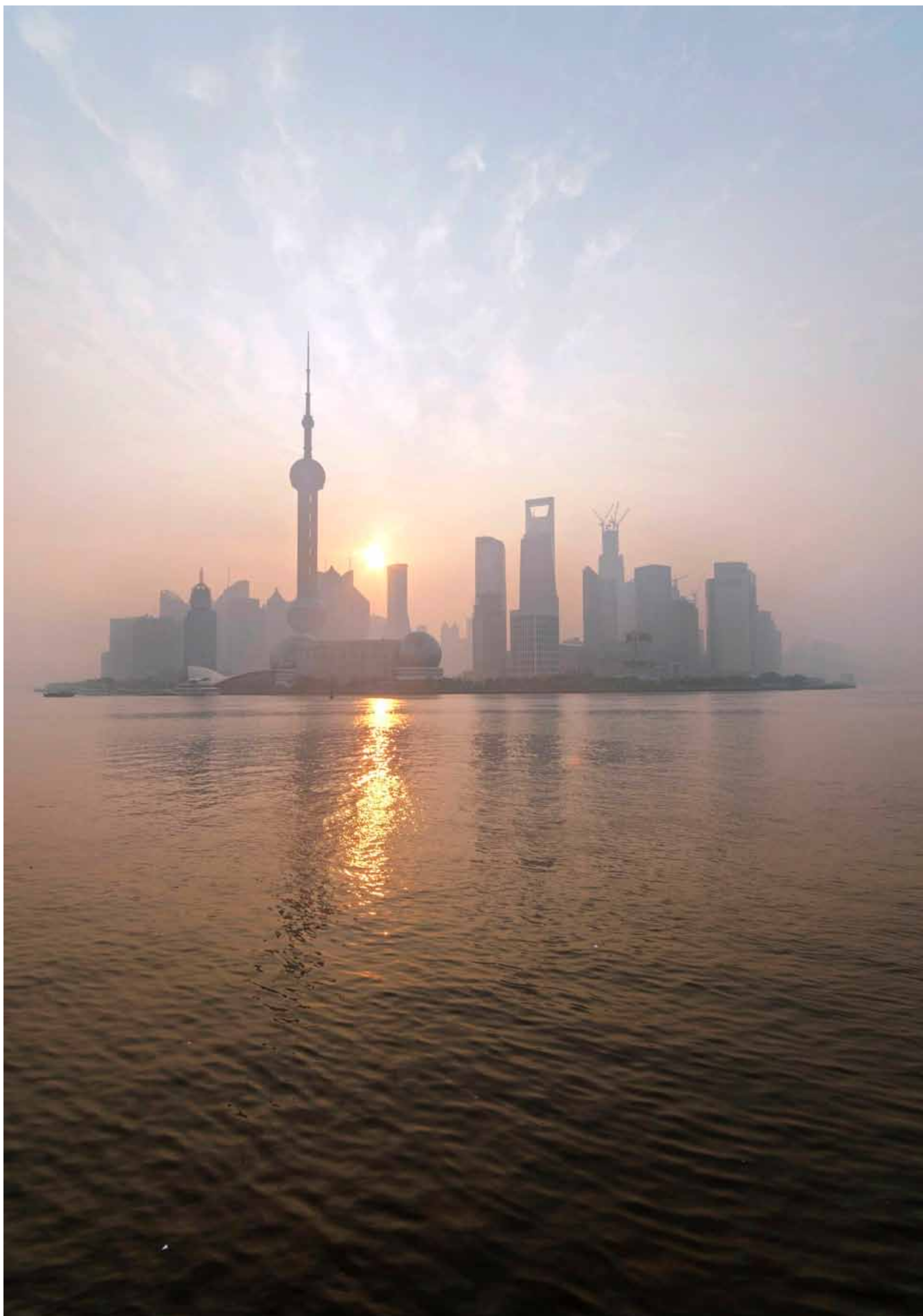
Shanghais kjente strandpromenade, The Bund, domineres den dag i dag av vakre småhus i europeisk, nyklassisk stil, men skyskraperbyen i den umiddelbare bakgrunnen ser temmelig truende ut.