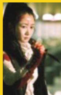
A TOUCH OF SIN Regissør: Jia Zhangke Kina, 2013