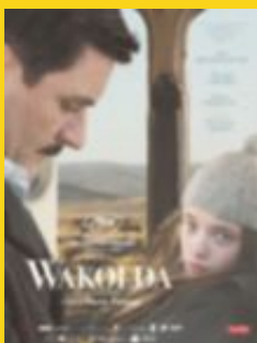
WAKOLDA Regissør: Lucía Puenzo Argentina, 2013