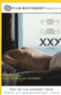
XXY Regissør: Lucía Puenzo Argentina, 2007