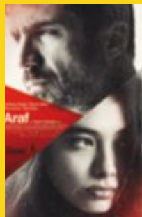
ARAF Regissør: Yesim Ustaoglu Tyrkia, 2012