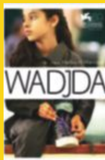
WADJDA Regissør: Haifa Al-Mansour Saudi-Arabia, 2012