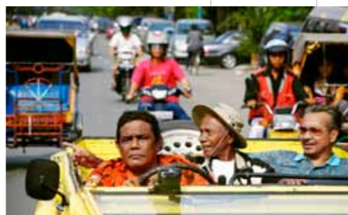
«The Act of Killing» (2012)

For Suharto var det kommunismen som var den store fienden, noe alle som har sett dokumentaren «The Act of Killing» vil vite.