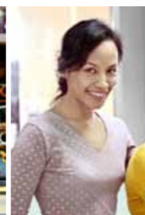
Forfatter Ayu Utami

I 1979 ble han overført til husarrest i Jakarta, og på grunn av en pussig juridisk overlevning fra før uavhengigheten, som sa at det kun var bøker som allerede var i sirkulasjon som kunne sensureres, var fortellingene om Minke i salg i Indonesia gjennom mesteparten av 1980-tallet. De oppnådde umiddelbar klassikerstatus, og var dermed sikret et liv som ettertraktet vare på svartebørsen idet de ble forbudt – et av mange eksempler på at undertrykkelse gjerne har motsatt effekt av hva man har ønsket.