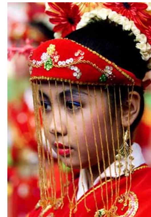
Stolte tradisjoner En indonesisk danser under 100-årsmarkeringen av fødselen til Indonesias grunnlegger Sukarno, 6. juni 2001.

Beundringen for alt som er urbant, moderne og nederlandsk må etter hvert vike for en større forståelse for sine egne landsmenn.