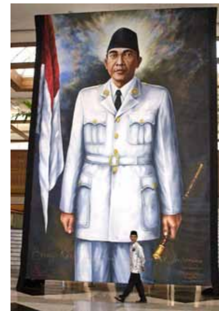
Najsonalsymbol Et gigantisk veggmaleri av Indonesias første president, Sukarno, på et konferansesenter i Indonesias hovedstad Jakarta, 6. juni 2001, på Sukarnos 100-årsdag. Sukarno var arkitekten bak Indonesias løsrivelse Nederland, og satt ved makten i 22 år.

Så lenge det ikke er foretatt noe virkelig oppgjør med Suhartos regime, vil Pramoedyas stemme fortsette å ringe i Indonesias samvittighet.