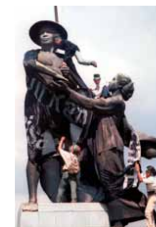
Uro Under en demonstrasjon i Jakarta 11. desember 1998, der muslimske demonstranter samlet seg for å kreve oppmerksomhet rundt vold mot muslimer etter økende religiøs uro i landet, ble et stort monument reist under Sukarnocæraen, tildekket med et svart banner der det sto skrevet «Ødelegg kommunistarven».

Og ingen vil noensinne kunne rokke ved klassikerstatusen til historien om Raden Mas Minke.