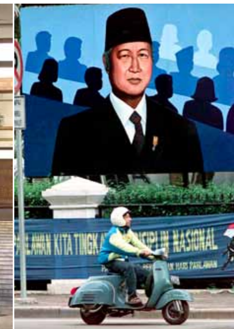
Sprekker i fasaden Indonesias andre president, Suharto, avbildet på en stor plakat i Jakarta, 9. desember 1997. Suharto gjenoppbygget forholdet til vestlige land i løpet av sin 31 år lange presidenttid frem til 1998, men hans regime var likevel en studie i undertrykkelse og korrupsjon.