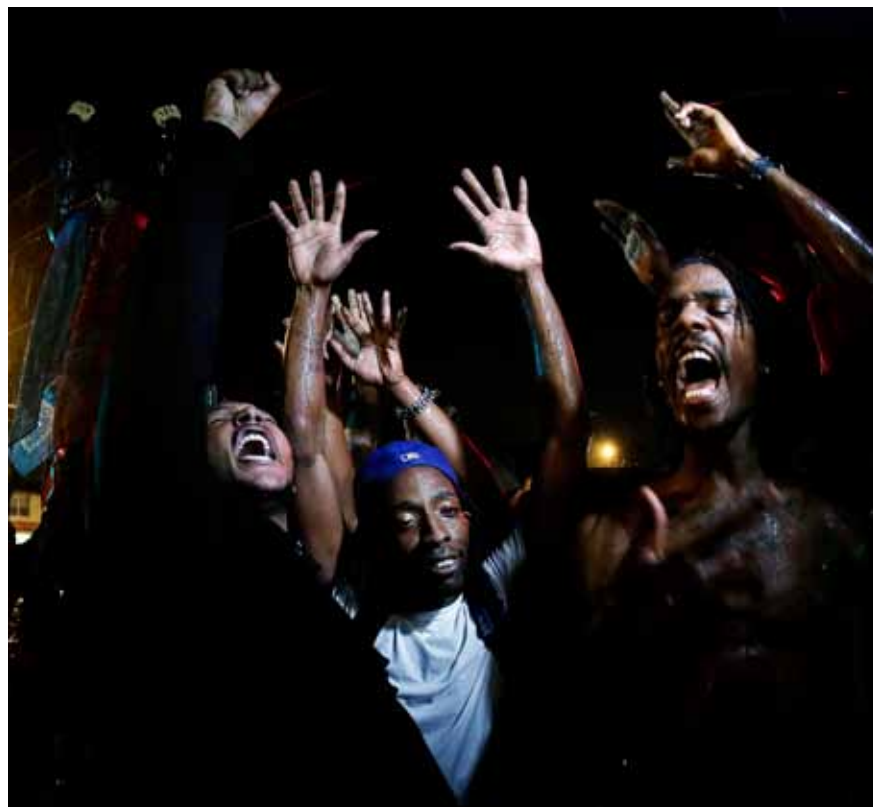
«Black Lives Matter» Folk trosset portforbudet, og røyk og tåregass ble brukt for å spre demonstrantene i Ferguson 17. august 2014. Drapet på Michael Brown 9. august førte til omfattende protester over hele USA og var en utløsende årsak til opprettelsen av bevegelsen «Black Lives Matter».

Tilgivelse. «Demokratiet er en tilgivende guddom», skriver han innledningsvis. For alle er jo enige om at USA er et demokrati, og lovene og reglene – som skal gjelde likt for