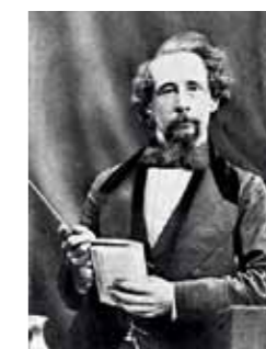
Charles Dickens var nærmest en besatt nattevandrer.

Alle oversettelsene er artikkelforfatterens egne, unntatt av Hamlet, som er gjendiktet av Øyvind Berg.