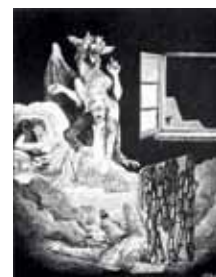
«The mad and the bad»

Det storbynatten opprinnelig hadde å tilby, var en marginal, ofte kriminell tilværelse, men mange forfattere har gjerne vært utstyrt med en kombinasjon av personlig fascinasjon og profesjonell nysgjerrighet som gjør at de på død og liv må oppsøke disse skyggesidene. Mørket bærer jo på så mange lokkende hemmeligheter.