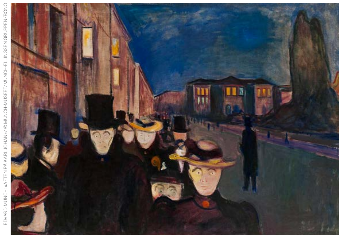
EDVARD MUNCH: «AFTEN PÅ KARL JOHAN»

Gustave Caillebotte (1848–1894) var en fransk impresjonist som hellet mot realismen. I mange malerier dokumenterte han de opprivende forandringene Paris ble gjenstand for under det andre keiserdømmet, og her – i «Sur le Pont de l'Europe» (1877) – ser vi en variant av et av hans mest kjente motiver: et spradende borgerskap som i vinterkulden nærmest blir overrumplet av de omgivelsene de selv har skapt. Det er den industrielle symmetrien som utgjør maleriets sentrum, og til sammenligning virker mennene lett rystet der de retter blikkene sine i hver sin retning. Med unntak av de hvite hanskene som matcher røykdotten fra toget på Saint Lazare-stasjonen i bakgrunnen, er det jernets blågrå farge som dominerer, og den låner av sin koloritt både til de fjonge klærne og det gufne været.