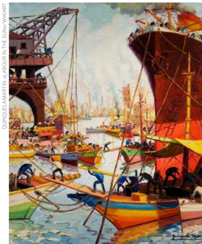
QUINQUELA MARTIN: «LABOUR IN THE SUN»/WIKIART