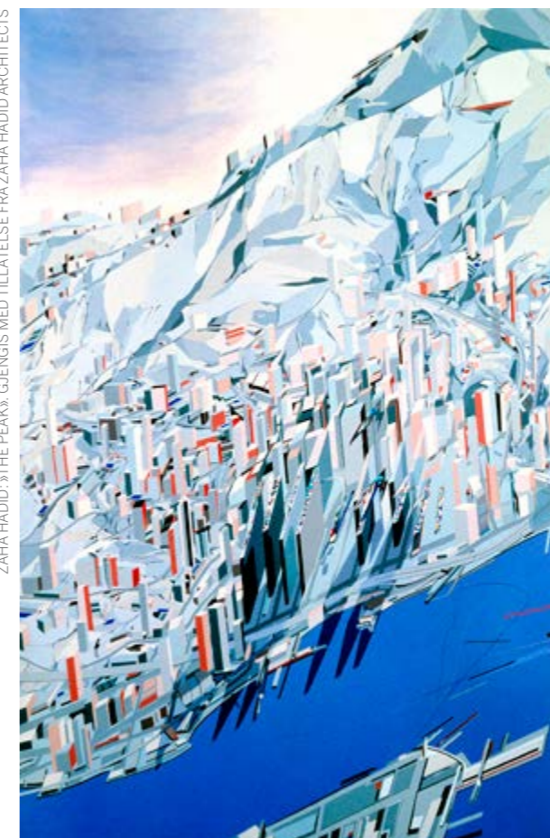
ZAHA HADID: «THE PEAK»

Anselm Kiefer (1945–) er kjent for de store dimensjonene både på sine malerier og skulpturer, samt at han gjerne klistrer glass, hår og plastobjekter inn i selve malingen som han påfører i tykke lag. «Lilith» forestiller en stor cityscape man betrakter ovenfra, med en firkantet plass eller en bred aveny foran en rekke høye bygninger som ser ut som ruiner. Dette maleriet fins i flere versjoner, og i denne er det påmontert et bombefly (eller papirfly) av bly i forgrunnen, med jetstråler av menneskehår, som sammen med den strengt økonomiske fargekombinasjonen av brunt og grått, gir bildet et pessimistisk uttrykk. Kiefers bilder gjør seg absolutt best på museumsvegger, og nysgjerrige kan beskue hans fabelaktige «Barren Landscapes» på Astrup Fearnley-museet i Oslo.