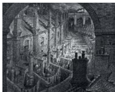
ZLATKO GRGIĆ: «BALTAZAR GRAD»/WWW.VISTRUEKA.HR