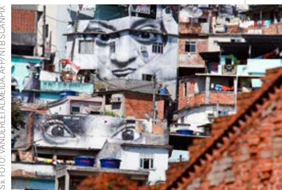
JR: «WOMEN ARE HEROES».

Jeffrey Smart (1921–2013) var en australsk maler som interesserte seg for mennesket i dets stadig mer surrealistiske urbane omgivelser. Det absurde i motivene hans har utvilsomt et islett av humor, men stort sett er det snakk om nærmest stjalne gjengivelser av malplasserte skikkelser omgitt av en urovekkende, trykkende stillhet. De velformede, men fremmedgjørende urbane landskapene hans er fylt av ensomhet, for vi er ikke skapt for å omgi oss med betongelementer, motorveistrukturer og tomme oljefat, men likevel har vi skapt det. Komposisjonen og geometrien («det gylnе snitt») bidrar til at Smarts bilder så lett fester seg til hukommelsen, som er tilfelle med «Cahill Expressway», der vi ser en resignert mannsperson som om han venter på en buss på et sted der ingen buss vil komme.