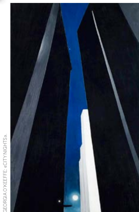
GEORGIA O'KEEFFE: «CITY NIGHTS»

Georgia O'Keeffe (1887–1986) omtales gjerne som den amerikanske modernismens mor. Innenfor tradisjonen med urbane malerier forbindes hun sterkt med de nye skyskraperne som gjorde seg mer og mer gjeldende, særlig i nord-amerikanske byer. «City nights» forestiller en scene i New York, der den nye arkitekturen inviterer nattevandrerne å vende blikket oppover. Maleriet loddrette «tendens» er virkelig sterk, og selv om både form og farge kan virke truende (skyskraperne formelig lukker seg over oss), så er dette fint balansert med en hvit bygning som en lys stripe i bakgrunnen. På denne tiden hadde også fotoapparatene gjort sitt inntog i allmennheten, og O'Keeffes arbeid viser hvordan malerkunsten tidlig lot seg inspirere av fotografiets muligheter.