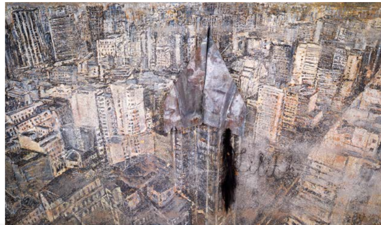
ANSELM KIEFER: «LILITH» © ANSELM KIEFER FONDATION BEYELER, RIEHN, SVEITS. FOTO: JOHN ABBOT, MED TILLATELSE FRA MARIAN GOODMAN GALLERY, NEW-YORK