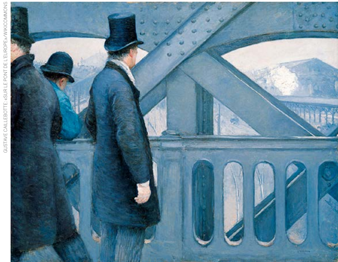
GUSTAVE CAILLEBOTTE: «SUR LE PONT DE L'EUROPE»