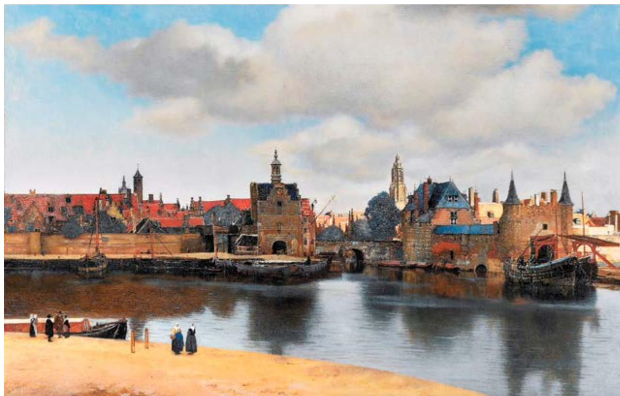
JOHANNES VERMEER: «GEZICHT OP DELFT»