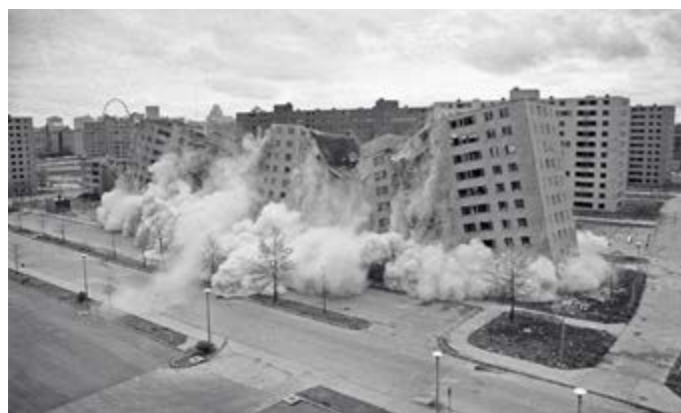
Rivningen av bydelen Pruitt-Igoe i St. Louis, Missouri foregikk fra 1972 til 1976.