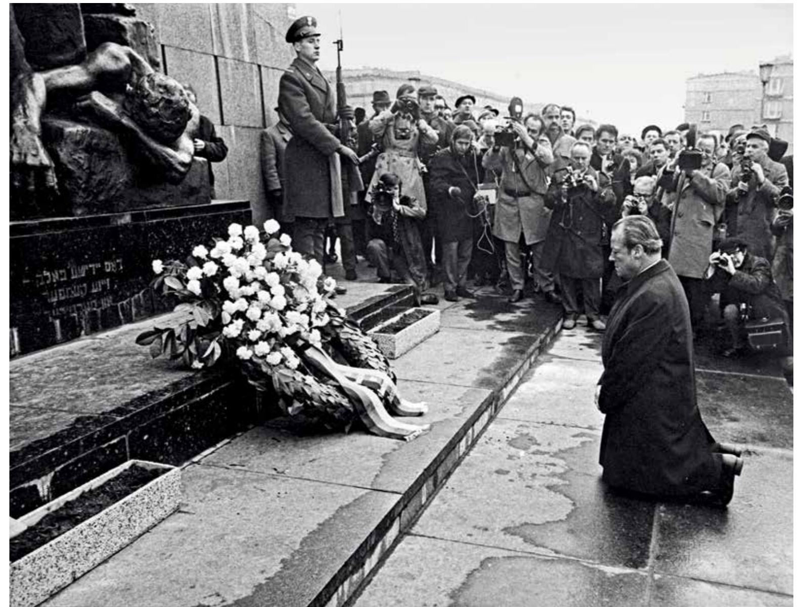
Symbolsk handling Willy Brandts gest foran minnesmerket for ghetto-opstanden i Warszawa 7. desember 1970 kalles på tysk bare for «Der Kniefall von Warschau».