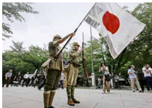
Shinto-helligdom Yasukuni i Tokyo er et minnesmerke til ære for 2,5 millioner falne japanske soldater fra 1855 til 1945. Da det i 1978 ble «oppdaget» at listen over falne inkluderte krigsforbrytere, sluttet keiseren å besøke Yasukuni.

Fornektelsens strategi. Det er ikke slik at det ikke ble gjennomført noe rettsoppgjør i Japan etter krigen. Tokyo-prosessen ble satt opp med Nürnberg som mal, også den styrt av USA, gjennom den egenrådige general Douglas MacArthur. Han rørte ikke keiser Hirohito, men