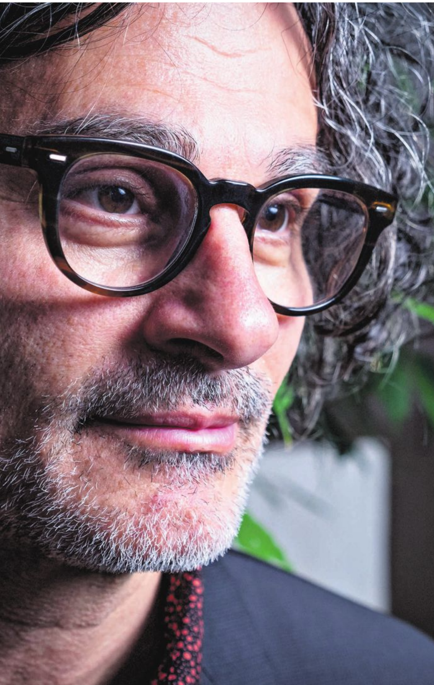
...rmelsen vises på Arabiske Filmdager i Oslo til helga. Regissøren kommer også til Oslo, men hans film skaper strid i hjemlandet.