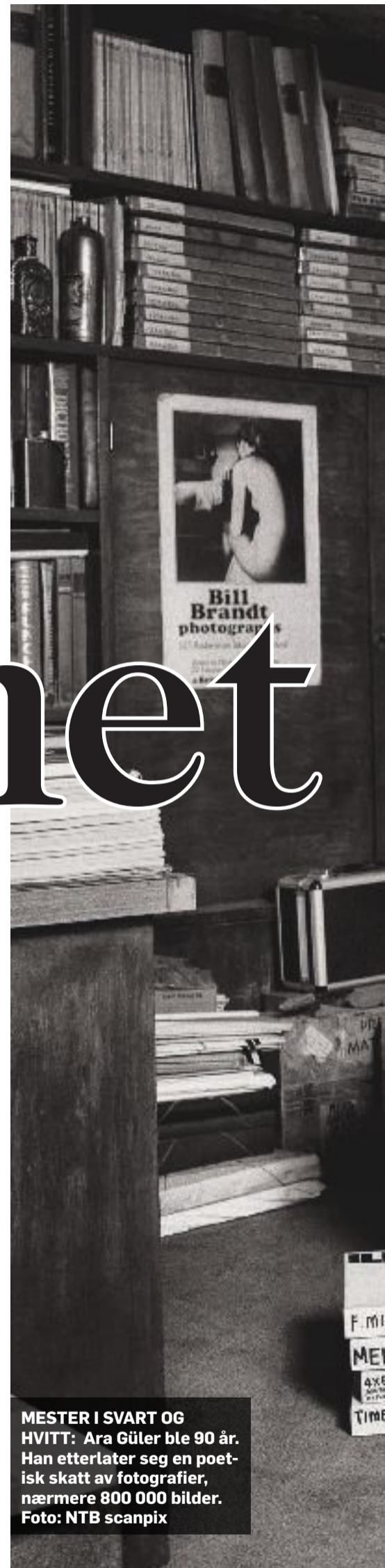
MESTER I SVART OG HVITT: Ara Güler ble 90 år. Han etterlater seg en poetisk skatt av fotografier, nærmere 800 000 bilder.

MEN DET ER ikke vanskelig å ane noe mørkere under overflaten her. «Bolis» fungerte som en intern nødhavn, men den armenske kolonien i storbyen har måttet venne seg til å leve med frykten for at et av barna skulle bryte ut i sitt hjems mål på åpen gate, for bare innenfor hjemmets fire vegger kunne de være seg selv.