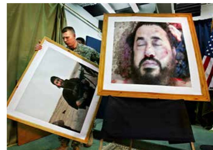
Demonisering av fienden En amerikansk soldat avbildet 8. juni 2008 idet han tar ned et bilde under en pressekonferanse i Bagdad for å henge opp et annet som viser den drepte Abu Musab al-Zarqawi som ledet Al-Qaida i Irak.

I så måte er artikkelen tankevekkende (om enn også nærmest patetisk i sin umyndiggjøring av steinkasterne), slik den illustrerer poenget om at innlevelsen i andres lidelse og død er svært selektiv.