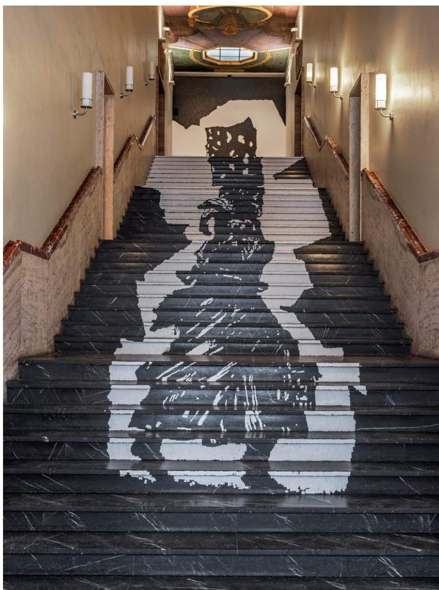
William Kentridge, Fire Walker , 2019. Installasjon på Kunstnernes Hus under Tegnetriennale 2019: Human Touch.

I forbindelse med vinterens Tegnetriennale på Kunstnernes Hus kunne man – inntil pandemien gjorde sin entré – se en variasjon av ett av hans mest ikoniske verk, kalt Fire Walker , i den sentrale trappen opp.