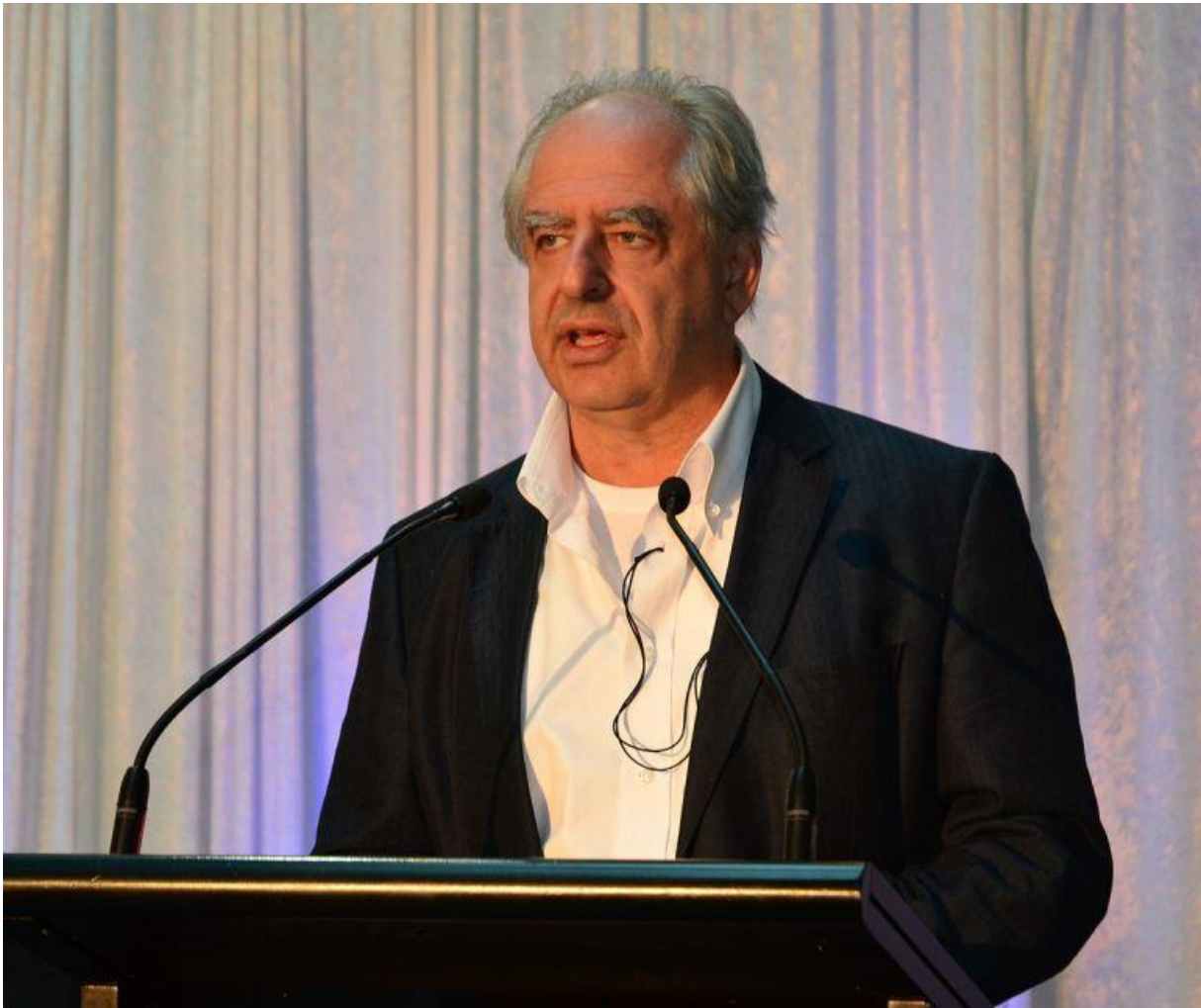
William Kentridge ved åpningen av en utstilling i Melbourne, Australia, 7. mars 2012.

Men sannheten var at flere norske familier som var involvert i skipsfarts- og industri profitterte stort på slavehandelen, og derfor bør vi nå benytte sjansen til å la oss berike intellektuelt ved å sette oss inn i hvordan dette har påvirket befolkningen på begge sider av Atlanterhavet, og fremdeles gjør det.