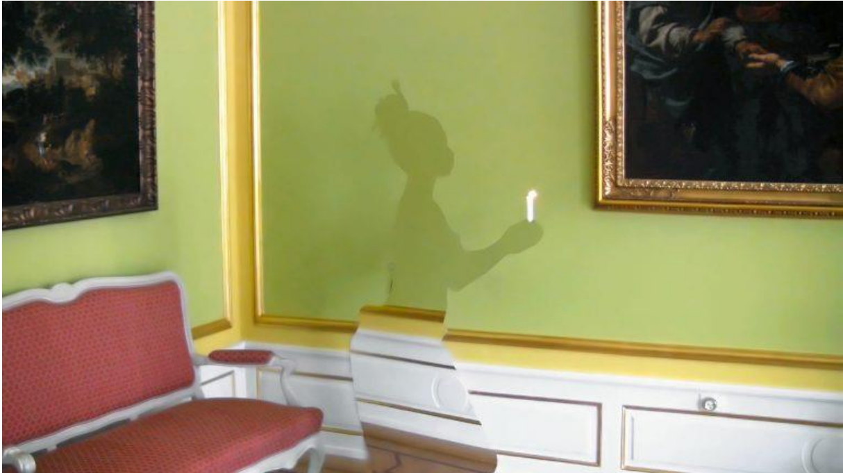
Pressebilde for «Black Magic at the White House», 2009

«Black Magic at the White House» består på sin side av en video av en skyggeaktig kvinneskikkelse, hvis profil viser dens afrikanske opphav, som utfolder seg i en ensom voodoo-dans i festsalen i Marienborg.