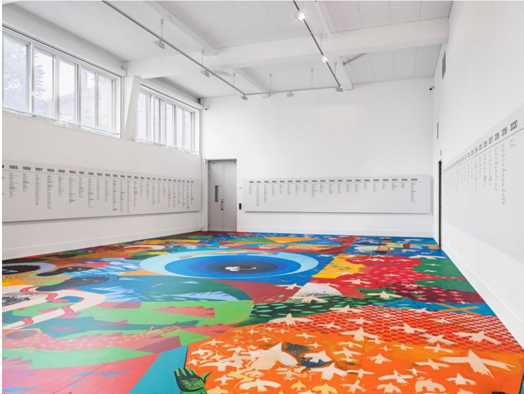
The Onset of Vertigo – av Fadlabi.

kunstneren Fadlabi har prydet gulvet med et fargerik bestillingsmaleri kalt « The Onset of Vertigo ». Dette kan man tråkke rundt på (uten sko, vel å merke), for å få med seg alle detaljene, for her er det også mer eller mindre skjulte hentydninger til husets egen og kunstens generelle historie.