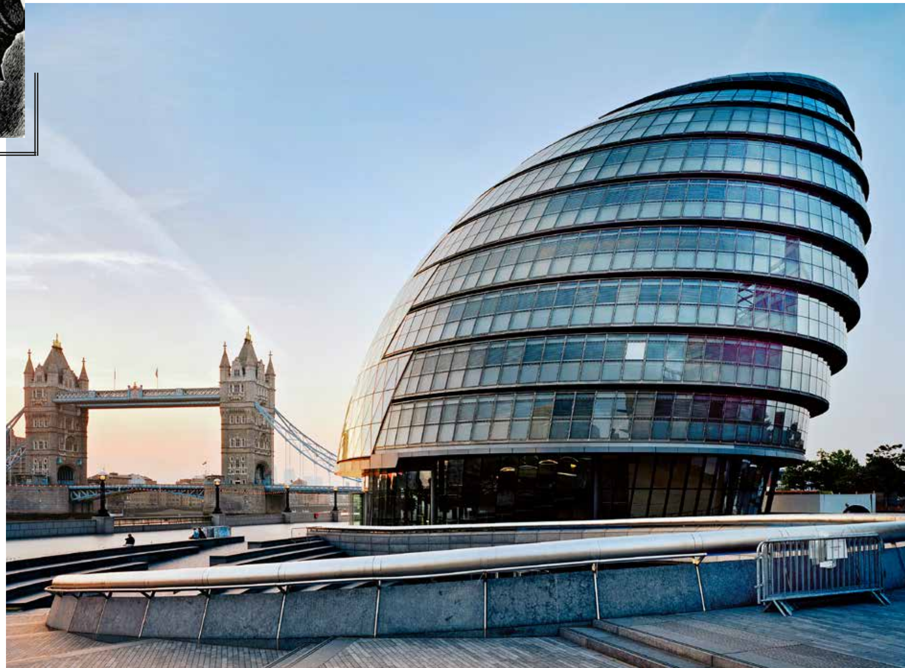
Uinntagelig rådhus Denne bygningen, tegnet av Foster and Partners, fungerte som Londons City Hall – Stor-Londons lokalmyndighet – frem til 2021. Illustrasjonen innfelt er fra Edgar Allen Poes «The Man of the Crowd».

Arkitekturens forhold til demokratiet vil være bestemt av stikkord som tilgjengelighet og innsyn. Innen litteraturen er det derimot snakk om utvidelse av klasseperspektivet og inkludering av minoriteter.