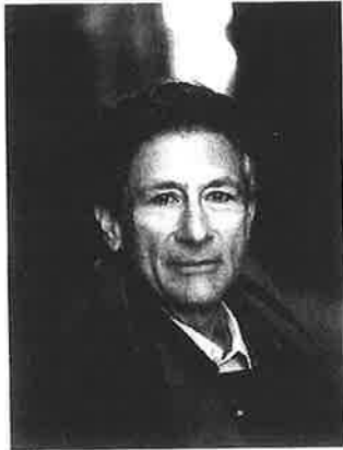
Edward Wadie Said (1935-2003).

Edward Saids tenkning førte til et noe så sjeldent som et paradigme-