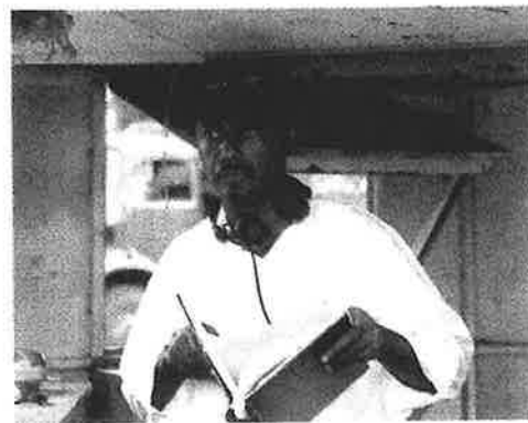
Raoul Peck ynder å portrettere den fattige øystatens skjebne i den nykoloniserte verden.