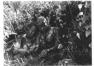
Martin Luther King Jr. s ord «Til slutt vil vi ikke huske ordene til våre fiender, men stillheten til våre venner» introduserer filmen «Sometimes In April».