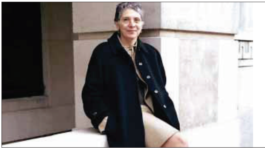
UBEHAG: Melanie Phillips er ute med en bok som er ubehagelig provoserende og opplysende, mener vår anmelder.

Phillips argumenterer videre for at den britiske statens unntakelighet - sammen med idéen om multikulturalismen - har gitt rom for det hun kaller moralisk inversjon . Det betegner en taktikk enkelte