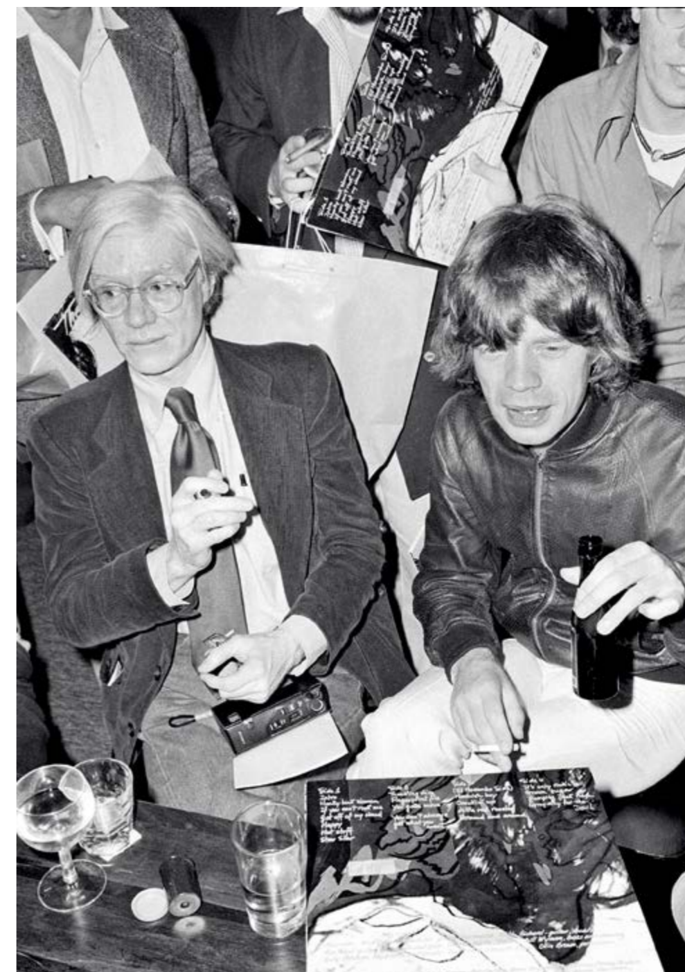
Sky festløve Kunstneren Andy Warhol på byen med Mick Jagger i 1977.

Promiskuitet og ekshibisjonisme kan anses som symptomer på den moderne ensomheten.