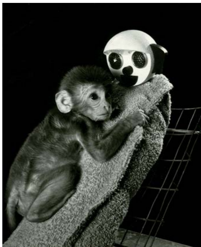
Søker trygghet En rhesusape-unge klamrer seg til en falsk morsfigur kledd i mykt skinn, under forsøk utført av den amerikanske psykologen Harry Harlow ved University of Wisconsin på 1950-tallet. Studiene avdekket at komfort, trygghet og nærhet er avgjørende faktorer for en sunn psykologisk utvikling hos apen.