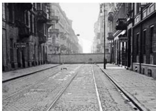
Warszawa-ghettoen Warszawa-ghettoen var den største jødiske ghettoen i det okkuperte Polen. I løpet av tre år sank befolkningen fra i underkant av en halv million mennesker til kun 37 000. I 1943 fant det første væpnede opprøret mot nazistenes jødeutryddelse sted her, men det ble brutalt slått ned.

Veien fra Venezias vindelbroer til Warszawas piggråder markerte også en annen viktig forskjell: I det første tilfelle var målet overvåking og kontroll gjennom segregasjon over tid, mens det i det andre handlet om utryddelse.