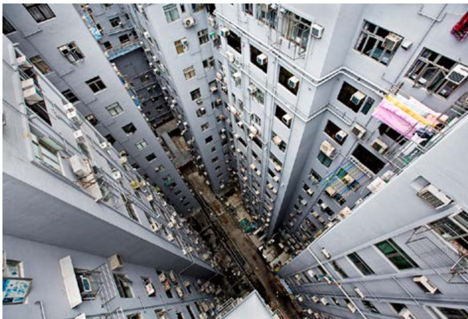
Trangbodd Chungking Mansion på Kowloon midt i Hongkong. Fem blokker «limt sammen» utgjør en ghetto for seg selv.

Chungking Mansions, en 17 etasjer høy bygning midt i et av Hongkongs travleste turiststrøk, spiller rollen som handelssentrum for en slags low-end globalization, for hit kommer handelsreisende fra hele Den tredje verden.