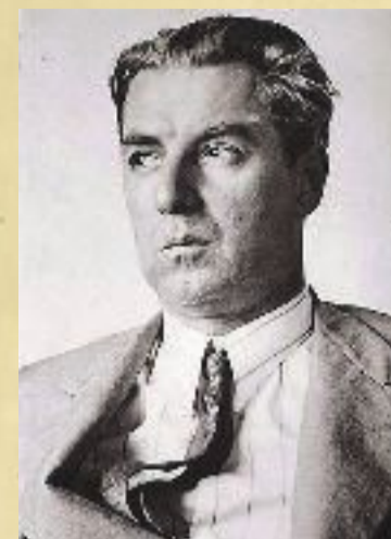
KULTROMAN: Roberto Arlt (innfelt) kom i 1929 ut med den argentinske kultroman «Los siete locos». Dette var samme år som krakket rystet børsene verden over, noe som nesten også fikk landemerket «Obelisco de Buenos Aires» til å skjelve.