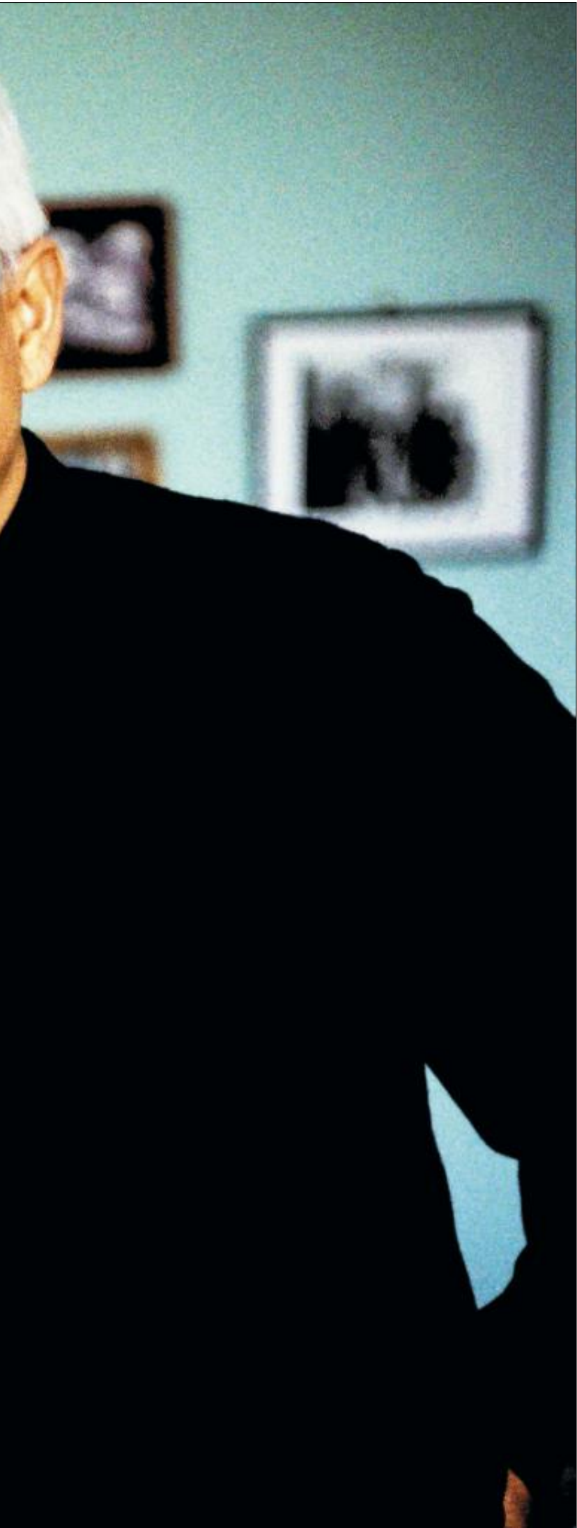
indiske forfatterlegenden er stadig opptatt av fortidens

bringe de to landene i konflikt igjen. Indias litterære liv har alltid vært av høyt kaliber, og nå blomstrer det mer enn noensinne. Likevel kan man av og til få inntrykk av at det kun er en liten kikk i utlendighet som skriver. Og i likhet med sine kolleger uttaler Ghosh seg nødig om det indiske kastesystemet. De skriver gjerne om det, men