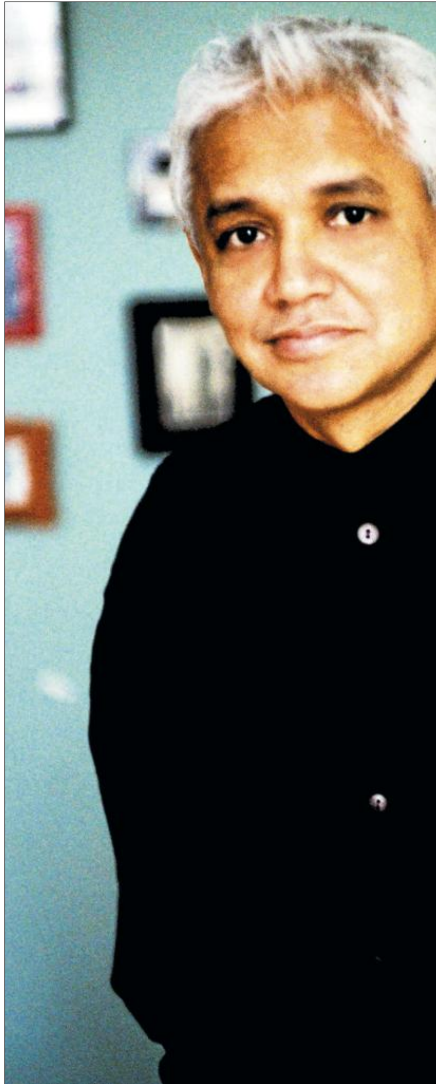
Amitav Ghosh er aktuell med ny romanutgivelse på norsk. Den aktualitet i nåtiden.

« Det er offisielt avskaffet for lenge siden, og nå har staten garantert at 35 prosent av jobbene skal reserveres for kasteløse.